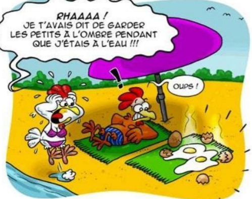
SOUS LES MOLLETS, LA PLAGE